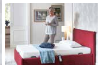
Super bequem und multifunktional