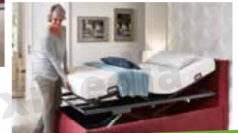
Gleich vorbeikommen oder anrufen!